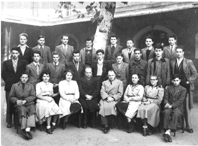
Collège Jean JAURÈS classes Sciences ex + Math. elem. 1948 - 1949

Et c'est ainsi que les dernières années d'études, bien conduites par de valeureux professeurs et agrémentées par la présence à nos cotés de sémillantes externes, nous permirent de clore avec succès ce parcours de lycéens en nous ouvrant le chemin des études supérieures qui furent pour moi celles d'ingénieur textile à Mulhouse.