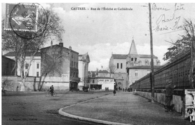
Le café Bouttes